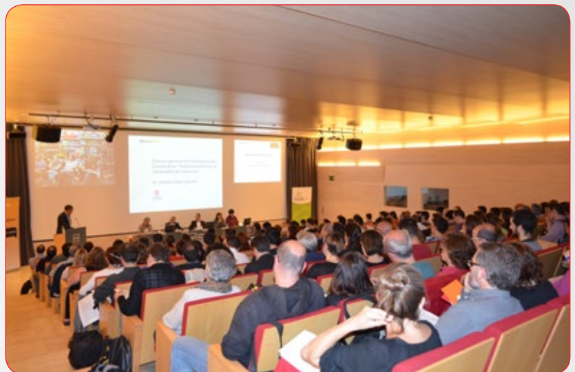
Auditori de la UPF