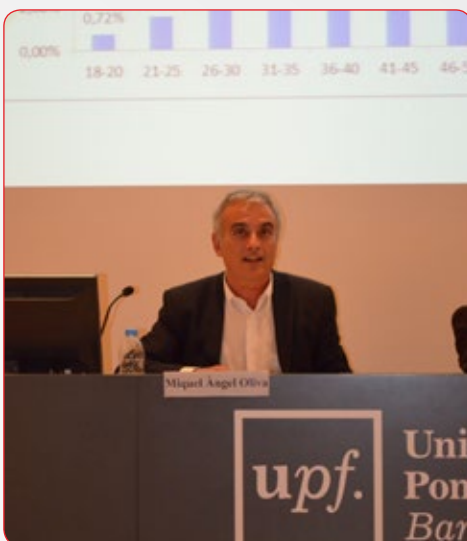
Director General Miquel Angel Oliva

A ressaltar també altres aspectes a banda dels resultats, la utilització de la telemàtica pel que fa a facilitar el seguiment i la participació tan a la general (amb vídeo conferència amb València) com a les preparatòries (amb vídeo conferència a les circumscripcions)